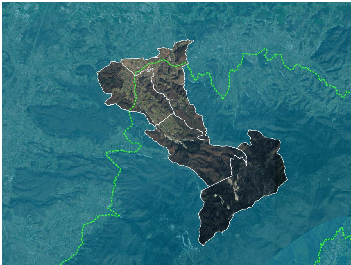
Granica obuhvata PPUO Stubičke Toplice

Ova izmjena i dopune Prostornog plana uređenja naselja Stubičke Toplice (dalje u tekstu: Plan) izrađuju se sukladno ciljevima i programskim polazištima utvrđenim Odlukom o izradi izmjene i dopune Prostornog plana uređenja Općine Stubičke Toplice (Službeni glasnik Krapinsko – zagorske županije br. 19/25).