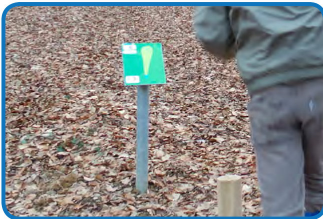
Tabla s planom staze

Koševi moraju biti proizvedeni prema propisima svjetskog udruženja igrača PDGA, a poželjno je da budu proizvedeni od strane jednog od eminentnih svjetskih proizvođača disc golf opreme poput: Latitude 64, Discmania / Disc golf park, Prodigy, Prodiscus