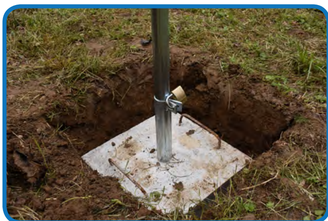
Tabla s planom terena - iskop rupe

Za postavljanje betonskog temelja table potrebno je iskopati rupu dimenzija 40 x 40 cm te dubine 50 cm.