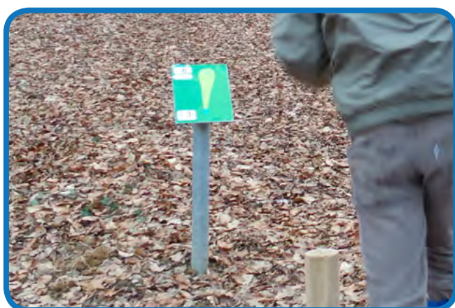
Tabla s planom staze - dovoz i postavljanje

Table je potrebno dovesti na teren i do mjesta postavljanja.