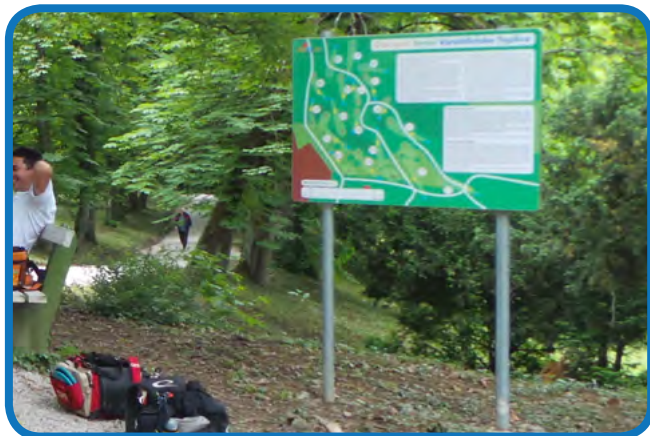
Tabla s planom terena - dovoz i postavljanje

Tablu je potrebno dovesti na teren i do mjesta postavljanja.