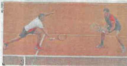
Mektić i Pavić poraženi su od Bobanina i Middelkoopa